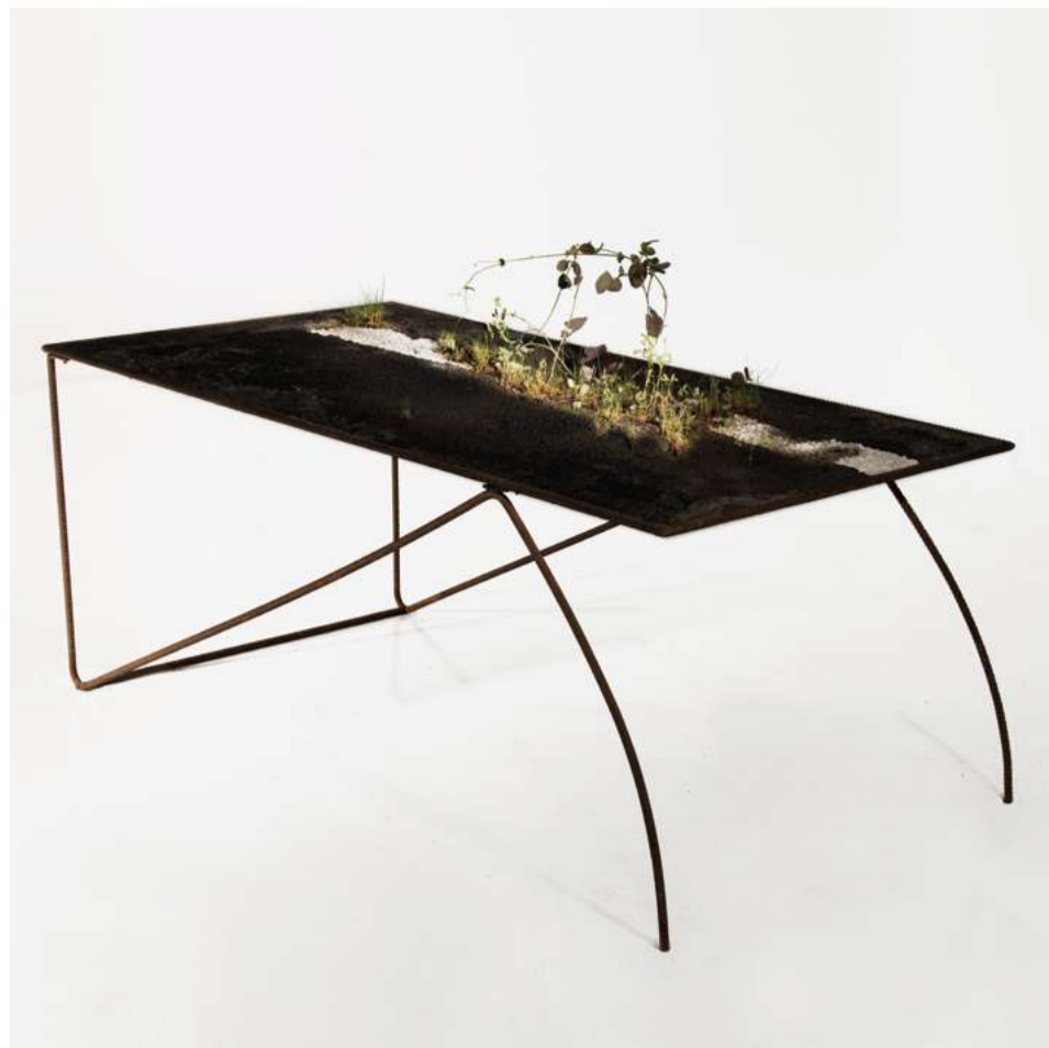
Tavolo forpandemic di Luca Gnizio, installazione sensoriale interamente realizzata con materiali di scarto.