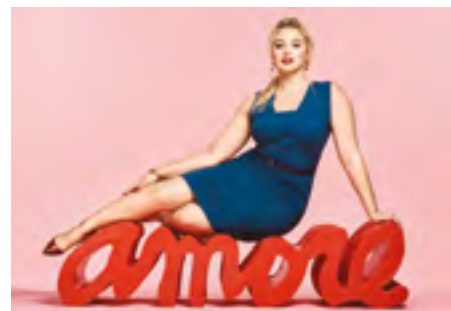
Chiara Ferella Falda

Un autunno effervescente negli studi fotografici Superstudio 13, tra nuove campagne internazionali, lanci mondiali prodotto e set blindati con inaccessibili celebrity. Cosmopolitan ha scattato qui la sua copertina di Ottobre con la modella curvy Iskra Lawrence (nella foto), attivista del #bodypositive, regina di Instagram (4,2 milioni di follower) e motivatrice dei Ted Talk. Rita Ora è una habituée dei nostri studi, ha posato sempre per Cosmopolitan, per poi scappare sul palco di XFactor dove era attesa come guest star internazionale. La fashion week ha visto invece protagonista lo showroom internazionale multibrand Tomorrow, un piccolo miracolo a management italiano diffuso anche a Londra, Hong Kong, Parigi e New York, una piattaforma di vendita, consulenza, servizi finanziari e di comunicazione per brand consolidati ma anche emergenti. Contemporaneamente una marea di modelle bellissime ha animato gli studi e il grande ingresso in occasione del mega casting per Yves Saint Laurent. E ancora la campagna internazionale fall/winter di Diesel con scatti di Saverio Cardia e la tecnologia più avanzata con l'evento Dyson che ha presentato il nuovo styler Airwrap con dimostrazione dal vivo e presenza di stampa italiana e estera.