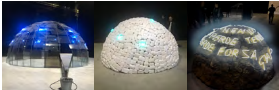
Vetri, acciaio, juta, pietre, neon, legno e altri materiali per i trenta Igloos di Mario Merz raccolti in una grande mostra da non perdere che si può vedere fino al 24 febbraio a Milano.