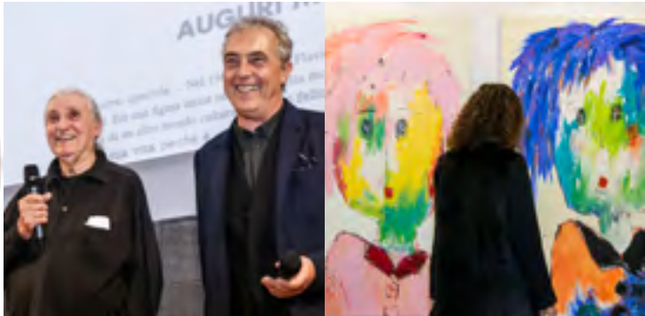
La scultura in ceramica di Lucchini per "Buoni come il Pane". Sempre alla Triennale Flavio Lucchini con Stefano Boeri per la serata a lui dedicata. Un'opera esposta AAF, Arte accessibile al Superstudio Più.