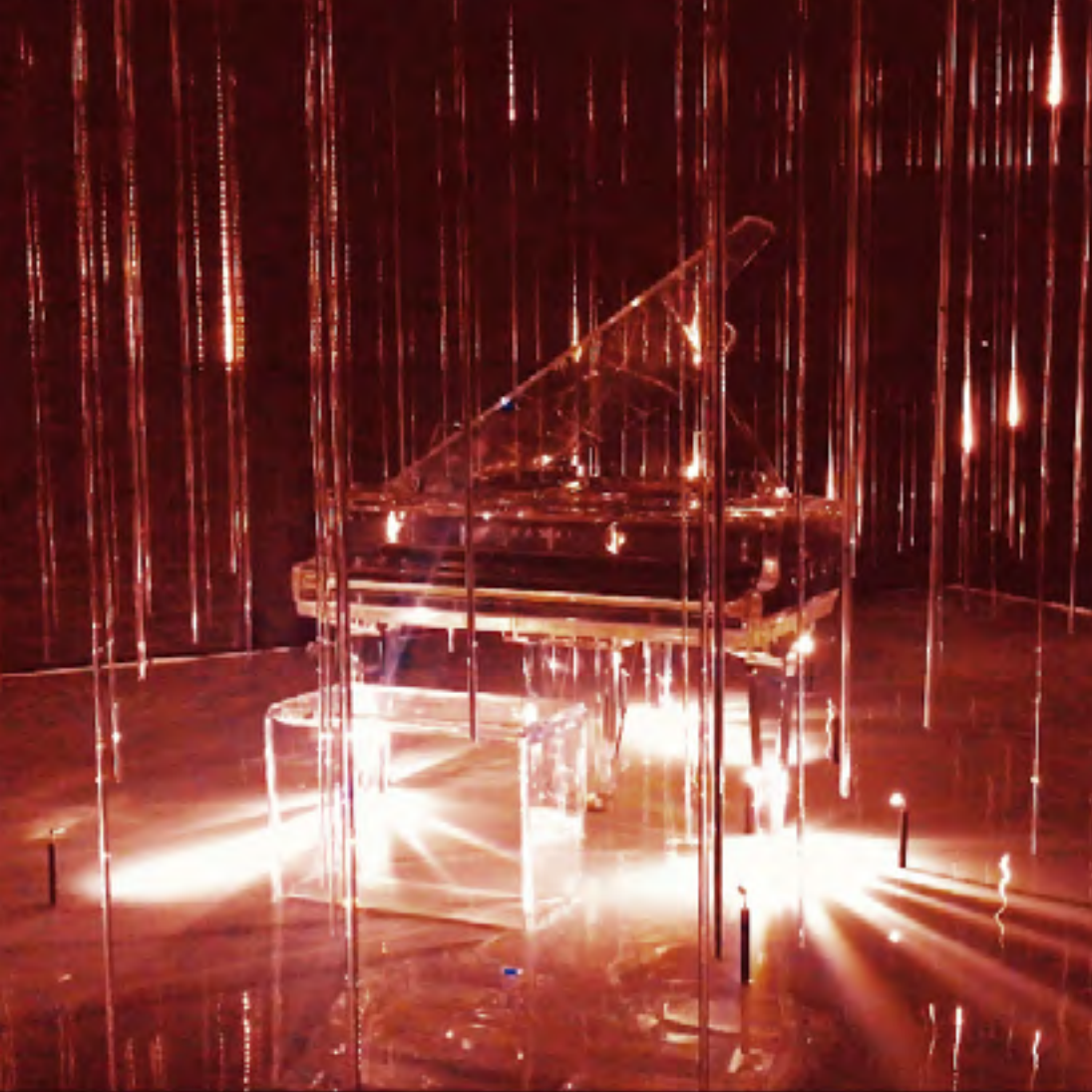
Il pianoforte che sprigiona note di luce, dell'azienda giapponese Kawai. Superdesign 2018.