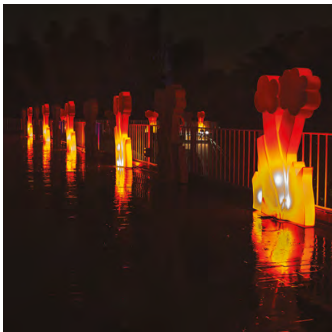
MyFlower, elementi divisori e luminosi disegnati da Flavio Lucchini per Slide, sul terrazzo della Triennale.