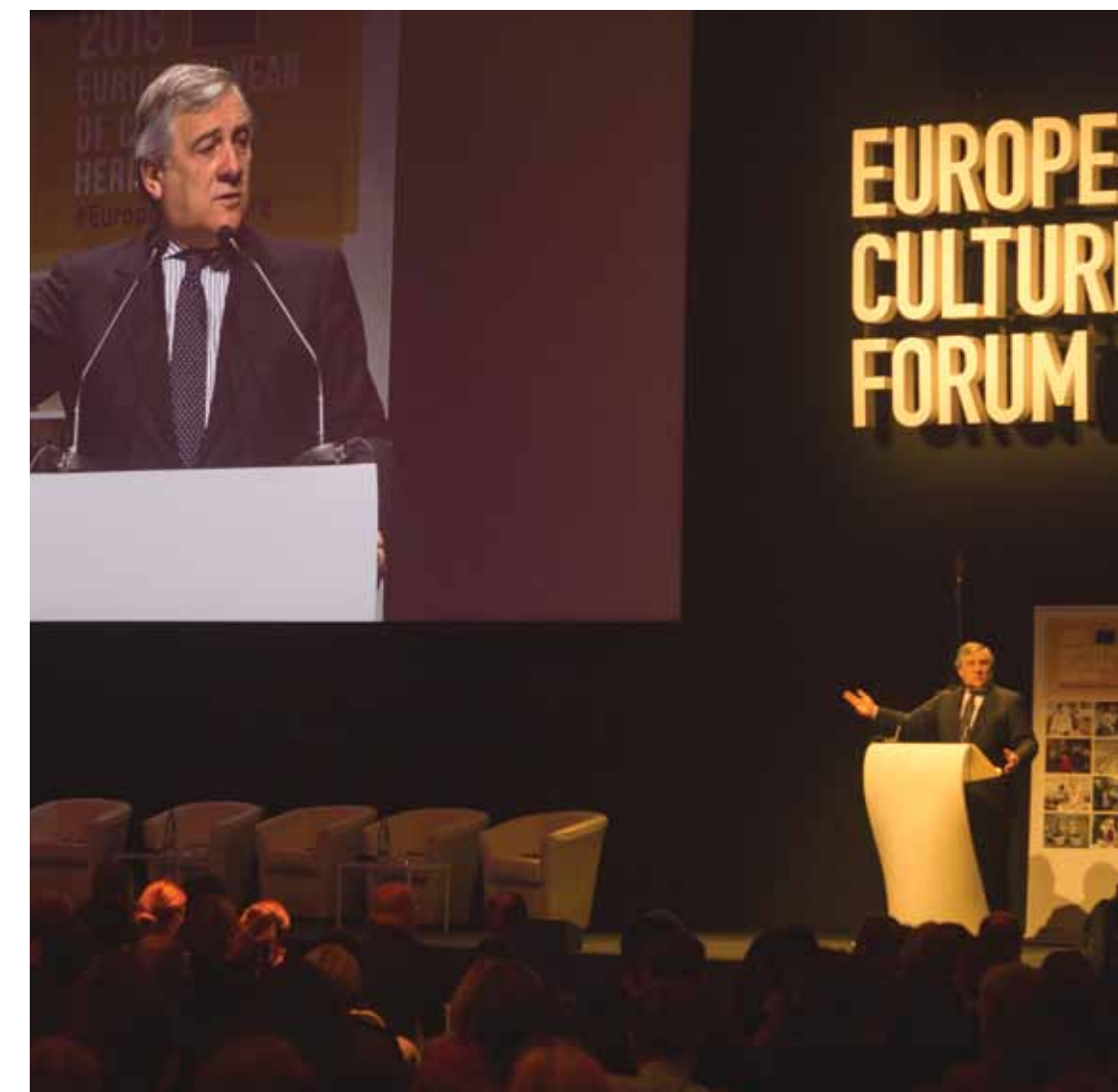
Antonio Tajani, Presidente del Parlamento Europeo.

Dall'alto: Jean-Claude Juncker, Presidente della Commissione Europea; Dario Franceschini, Ministro dei Beni e delle Attività Culturali e del Turismo; Giuseppe Sala, Sindaco di Milano; la sala conferenza gremita durante l'intervento di Tibor Navracsics, Commissario Europeo per l'Istruzione la Cultura la Gioventù e lo Sport; panoramica dell'esposizione sul tema del Patrimonio Culturale mondiale; un momento di relax con il ballo finale; il ledwall di Superstudio per la comunicazione dell'evento all'esterno.