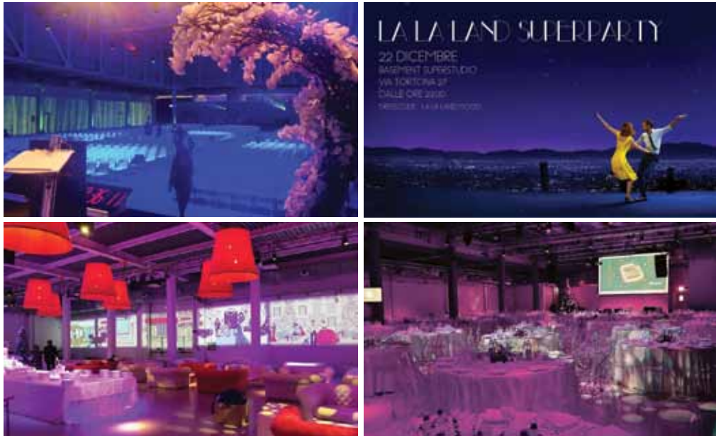
Cene di Natale al Superstudio Più.

È così: anche gli eventi seguono un trend. Sono attraversati da un fil rouge cromatico che si ritrova nella maggior parte di essi. Se nel 2015 è stato il blu profondo, nel 2016 il rosso passione, quest'anno ha visto una vera esplosione del viola nelle sue sfumature, più o meno luminose, dal lilla al viola quasi blu. Un colore inusuale per un evento, non facile ma originale e di grande atmosfera. Qui al Superstudio, il colore viola hanno reso unici eventi per banche d'affari, cene di gala per multinazionali del farmaco, convegni di IT per una volta sbalanzati da una nuance inattesa. E non è un caso che il sempre attesissimo party di fine anno di Superstudio sia in tema La La Land , il musical con i tramonti più spettacolari del cinema nell'ultimo anno.